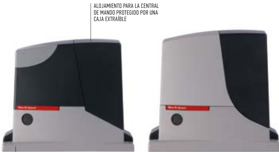
BASE Y DESBLOQUEO DE ALUMINIO FUNDIDO A PRESIÓN CON PINTURA EPOXI

*Considerando una instalación típica y excluyendo movimientos de aceleración y deceleración.