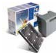
● KIT PARA LA ALIMENTACIÓN SOLAR SOLEMYO PARA AUTOMATIZAR PUERTAS, PUERTAS DE GARAJE Y BARRERAS DE ACCESO SITUADAS INCLUSO LEJOS DE LA RED ELÉCTRICA, SIN LA NECESIDAD DE REALIZAR EXCAVACIONES COSTOSAS E INVASIVAS. VÉASE PÁG. 171