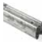
XBA9 UNIÓN PARA EXPANSIÓN. UDS./PAQUETE 1