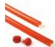
XBA13 GOMA PARAGOLPES DE 1 m. UDS./PAQUETE 9