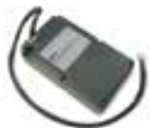
PS224 BATERÍA COMPENSADORA DE 24 Vdc. UDS./PAQUETE 1