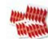
WA10 FRANJAS ROJAS ADHESIVAS REFLECTANTES. UDS./PAQUETE 24