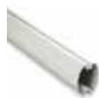
XBA5 MÁSTIL DE ALUMINIO PINTADO DE BLANCO 69x92x5150 mm. UDS./PAQUETE 1