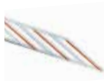
WA13 RASTRILLERA DE ALUMINIO DE 2 m. UDS./PAQUETE 1