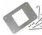
XBA17 BASE DE CIMENTACIÓN CON GRAPAS PARA LBAR. UDS./PAQUETE 1